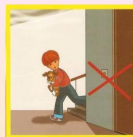
Лифтом пользоваться нельзя!

Если вы находитесь в здании, по возможности спуститесь на нижний этаж в более безопасное место без большого количества застекления, в подвал или подземный паркинг. Не пользуйтесь лифтом!